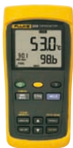
Fluke 53 II