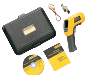
Fluke 566 с комплектом принадлежностей