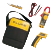
Fluke 62/322 kit