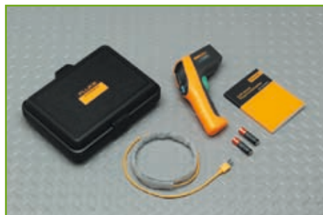
Термометр Fluke 561 включает в себя все функции, необходимые для проведения быстрого обследования.