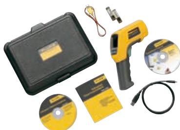
Fluke 568 с комплектом принадлежностей