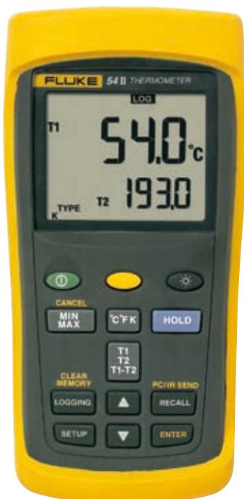
Fluke 54 II