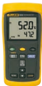
Fluke 52 II