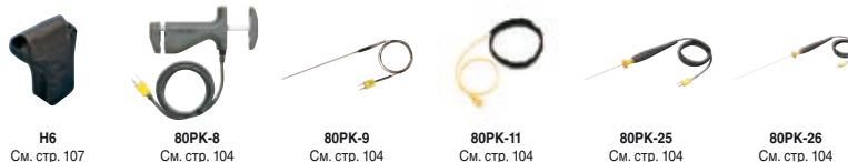
H6 См. стр. 107