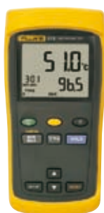
Fluke 51 II