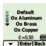
Выберите поверхность для измерения