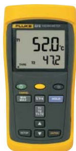
Fluke 52 II