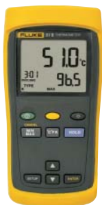
Fluke 51 II