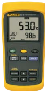
Fluke 53 II