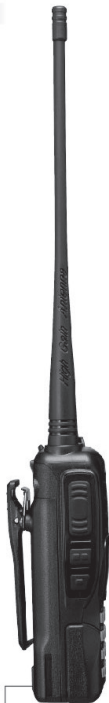
Показано с EBP-87