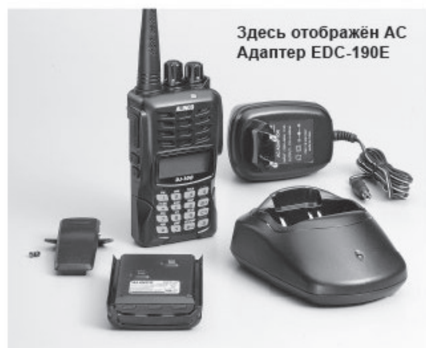
Здесь отображён AC Адаптер EDC-190E

Стандартная комплектация заявленная здесь, является заводской по умолчанию и может измениться на момент продажи, в зависимости от рынка и политики продаж Дилерами.